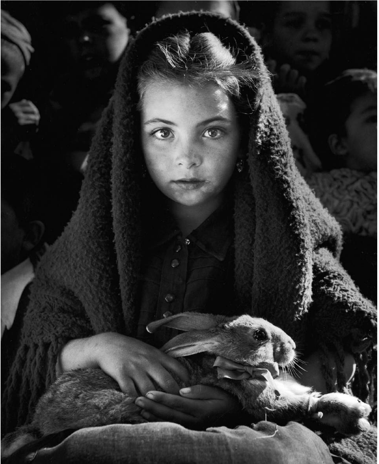
Jean Dieuzaide La petite fille au lapin , Nazaré, Portugal, 1954 photographie argentique sur papier 40 x 30 cm