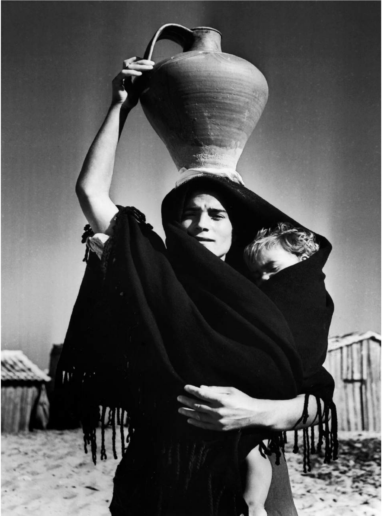
Jean Dieuzaide Maternité, Veira de Leiria, Portugal, 1954 photographie argentique sur papier 40 x 30 cm