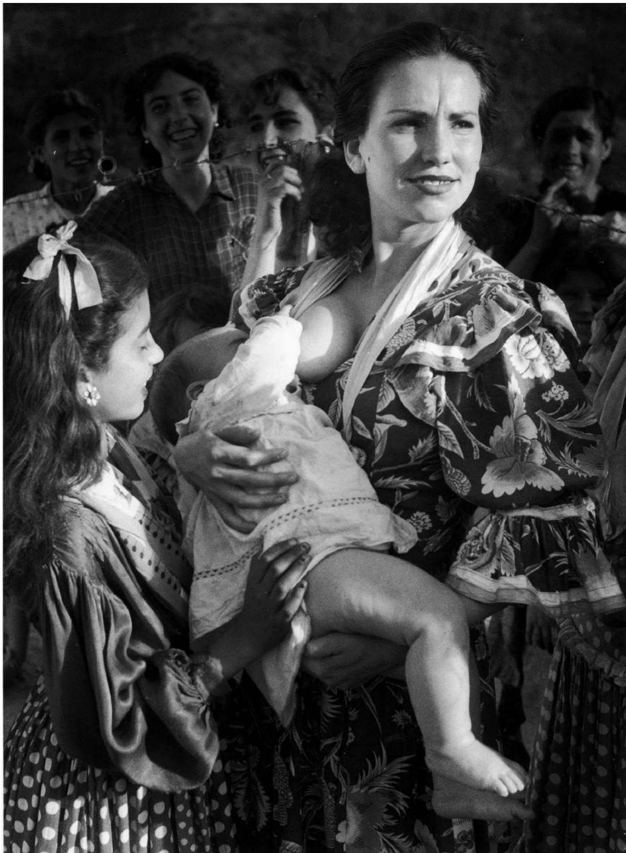
Jean Dieuzaide La gitane de Sacro-Monte, Grenade, 1951 photographie argentique sur papier 40 x 30 cm