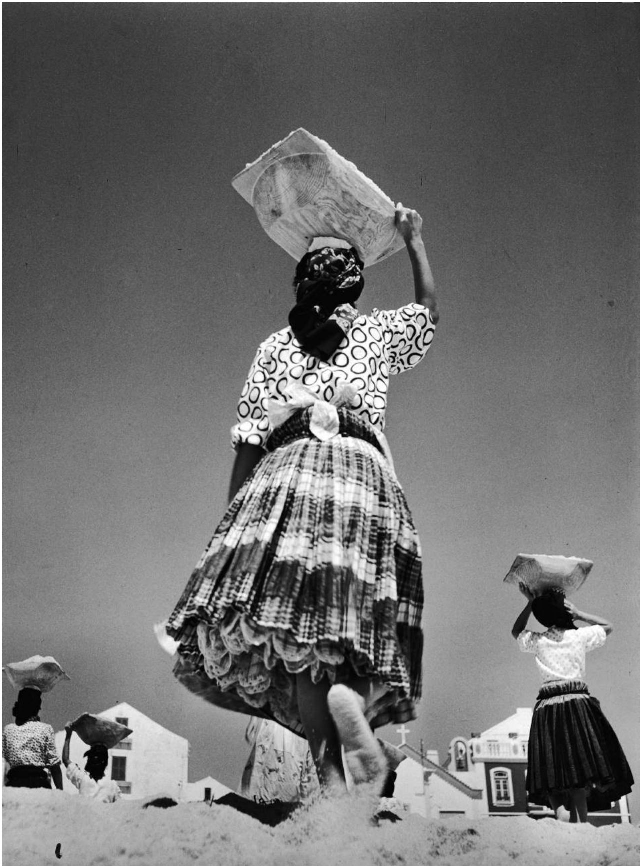
Jean Dieuzaide Les sept jupons , Nazaré, Portugal, 1954 photographie argentique sur papier 40 x 30 cm