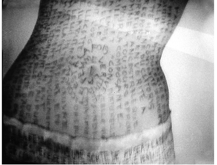
Nil Yalter The Headless Woman or The Belly Dance