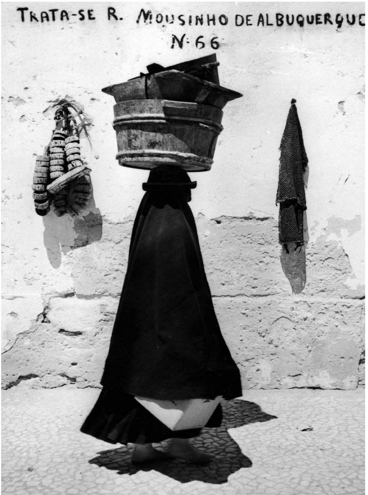
Jean Dieuzaide La silhouette portugaise, Nazaré, 1954 photographie argentique sur papier 40 x 30 cm