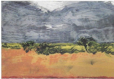
En haut : Marine Wallon , Point rouge ligne jaune XV , 2022, crayon et huile sur papier, 45 x 65 cm.

Galerie Catherine Issert.